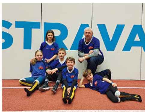
Duben — ještě tam budem