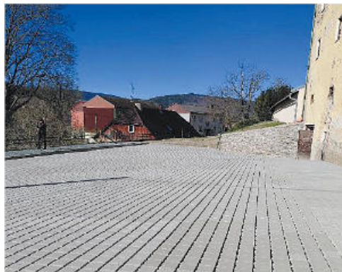
Investiční akce roku 2026