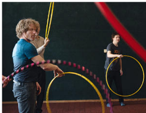
Cirkus v Dešenicích